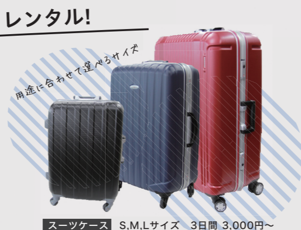
スーツケース S,M,Lサイズ 3日間 3,000円~