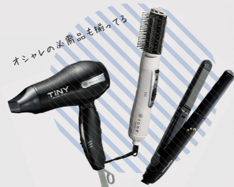
海外用ヘアアイロン・ドライヤー・カールドライヤー 10日間 1,500円