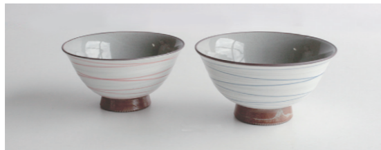
* 化粧こま筋 各800円