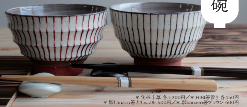
* 化粧十草 各1,200円 / * HIBI箸置き 各450円 * 彫hanaco箸ナチュラル 500円 / * 彫hanaco箸ブラウン 600円