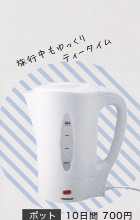
ポット 10日間 700円