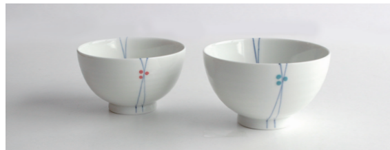
* うらら 各900円