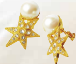
Star Pearl Earring

スターモチーフに大きめのパールがインパクトのイヤリング。メタルベースで、甘すぎず大人っぽく仕上がる。