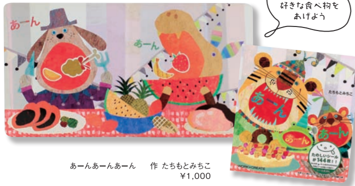
あーんあーんあーん 作 たちもとみちこ ¥1,000