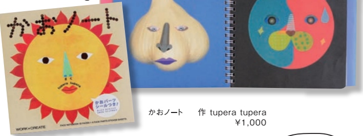
かおノート 作 tupera tupera ¥1,000